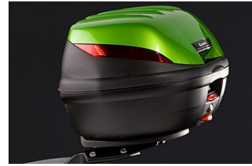
TOPCASE 39L € 114,75