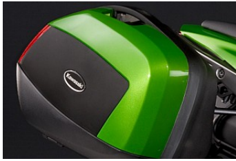
ABDECKUNGEN FÜR MOTORRADKOFFER € 81,05