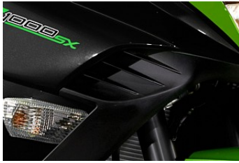
Cool Air System