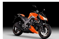
Candy Burnt Orange/Metallic Spark Black (Orange/Schwarz)

Unverbindliche Preisempfehlung in Euro. Zuzüglich Fracht + Nebenkosten.