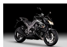
Metallic Spark Black (Schwarz)