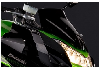
WINDSCHUTZSCHEIBE Z1000 € 85,95