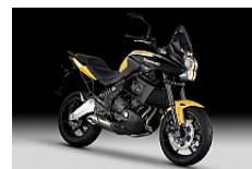
Pearl Solar Yellow/Ebony (Gelb/Schwarz)

Die äußerst vielseitige Versys ist für alle Einsatzzwecke geeignet – für die Fahrt zur Arbeit, für die Tour oder einfach für den Spaß an der Freude. Jede Straße, jederzeit, die Versys ist immer erste Wahl.