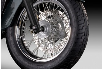
Neu trifft alt