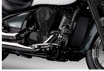
Aus dem Maschinenraum