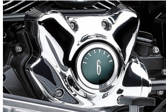
Sechsganggetriebe mit Overdrive