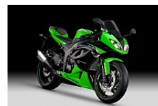
Lime Green / Metallic Spark Black (Grün/Schwarz)

Unverbindliche Preisempfehlung in Euro. Zuzüglich Fracht + Nebenkosten.