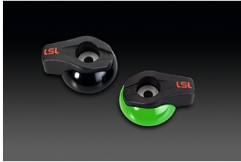
RAHMENSCHÜTZER LSL RACING € 49,05

Dieses Teil / diese Teile sind ausschließlich für den Wettbewerbs- oder Renneinsatz bzw. wettbewerbsähnliche Veranstaltung Deshalb ist die Verwendung bzw. der Anbau mit einem Ausschlussvermerk in den Kawasaki Produkt- und Garantiebedingungen v