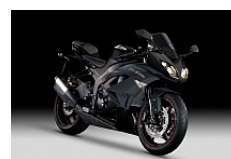
Metallic Spark Black / Flat Ebony