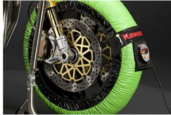
REIFENWÄRMER € 1.376,10