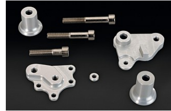
RAHMENSCHÜTZER-HALTERU NGEN LSL RACING € 79,70